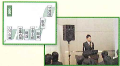
全国各地で開催している講習会