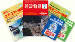
月刊誌・季刊誌・Web関連商品