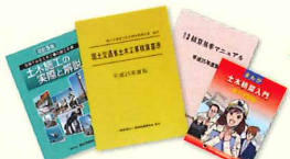
積算関連技術図書