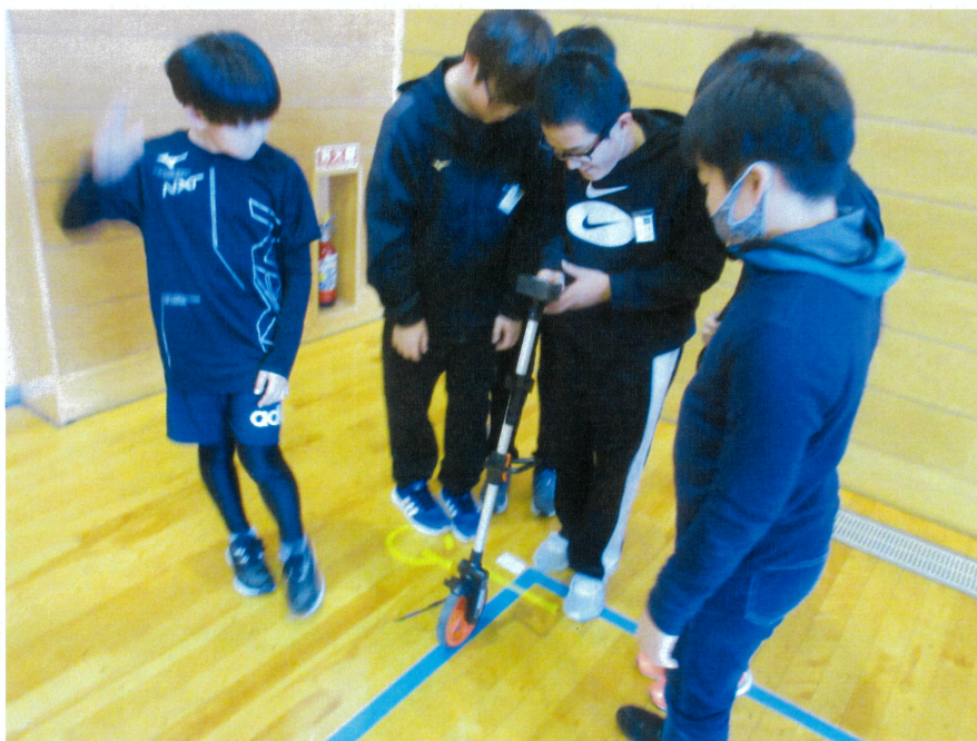
ユメココ教室 東通小学校5, 6年生