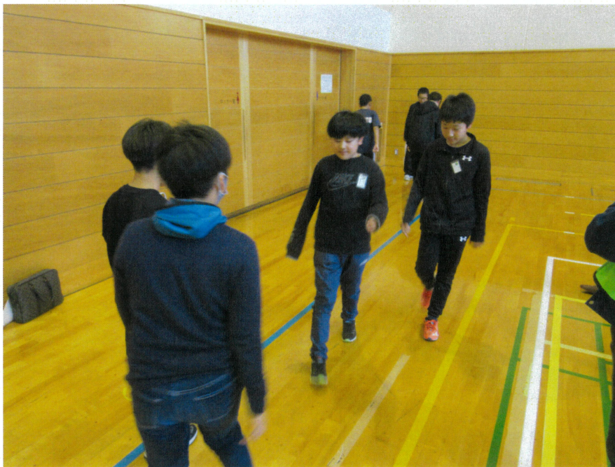
ユメココ教室 東通小学校5, 6年生