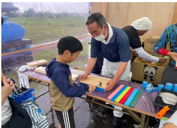
☆チョークボードペイント☆