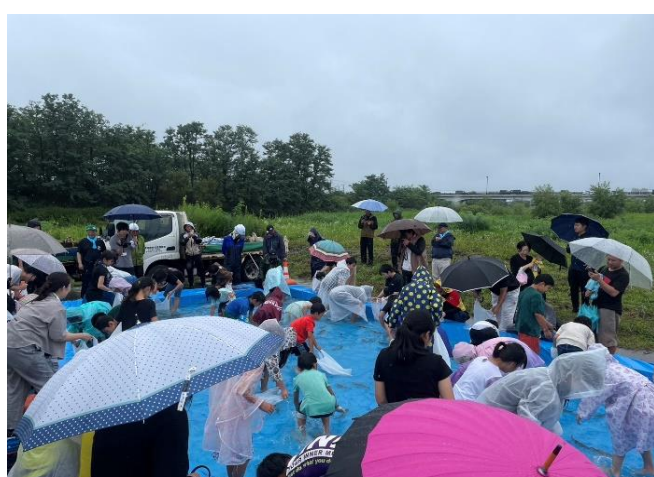
○迷げる魚を追いかけて一生懸命です○