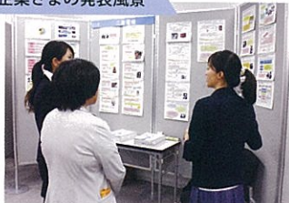
企業さまの発表風景

I TKエンジニアリングジャパン/旭化成/あさひ製菓/atelier fos一級建築士事務所/アルプス電気/アンリツエンジニアリング/インテック/NEC ネットズエスアイ・エンジニアリング/NTTデータ/NTTファシリティーズグループ/NTT PCコミュニケーションズ/荏原製作所/オークマ/大阪ガス/OKI ソフトウェア/オプティム/オリエンタルモーター/香川シームレス/鹿島クレス/鹿島建設/片山工業/関西チューブ/関西電力/キャプテンライン/京セラコミュニケーションシステム/協和エクシオ/KI Lab/KSF/KVH/神戸工業試験場/コーセル/国際ソフトウェア/国土交通省近畿地方整備局/国土交通省中国地方整備局/コベルククレーン/小松電子/五洋建設/西条環境分析センター/三晶MEC/GEヘルスケア・ジャパン/JRCS/JXエンジニアリング/四国電力/システム・インスツルメンツ/シスメックス/シチズン時計マニュファクチャリング/島津エス・ディー/清水建設/シャルマン/昭陽汽船/シンセメック/住化分析センター/第一化工/第一三共プロファーマ/ダイキン工業/大成建設/ダイナックス/太平エンジニアリング/竹中工務店/タダノ/TANAKAホールディングス/田淵電機/知能情報システム/中部電力/TDK/ディスコ/寺崎電気産業/テラテック/デンソー/東亜合成/東京エレクトロン/東京コンサルタンツ/東京コンピュータサービス/東芝/東ソー情報システム/東洋鋼板/東和薬品/ドーコン/ドコモCS中国/西島製作所/中西金属工業/長峰製作所/日東分析センター/日本オーチス・エレベータ/日本コンピュータ開発/日本システム開発/日本信号/日本分光/日本ミクニヤ/日本無線/ハイマックス/はてな/半導体エネルギー研究所/PFU/日立アドバンスシステムズ/日立システムズ/日立パワーソリューションズ/ヒューテック/ファインネクス/富士ソフト/富士通/富士通エフサス/富士電機/プロアシスト/プロビズモ/北陸コンピュータグラフィックス/北陸電力/北海道開発局/北海道建設部/北海道電力/ボッシュ/堀場製作所/マイクロ波化学/マイスターエンジニアリング/マツダ/ミズノマシナリー/三菱地所コミュニティ/三菱重工業/三菱電機/三菱電機エンジニアリング/三菱レイヨン/三原汽船/ミライト/妻鳥通信工業/矢崎総業/横河ソリューションサービス/リガク/レクザム/レザック/YKKグループ/Y2S