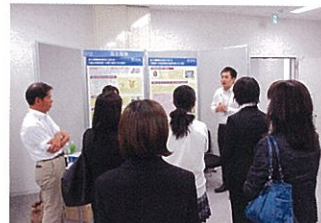
女子学生の発表風景