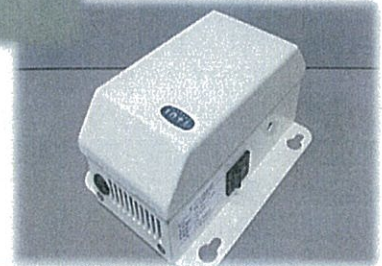
県動物愛護センターに設置 オゾン消臭機(アンデス電気(株))