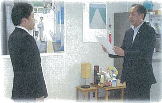
部長による新規認定者に対する認定書交付式