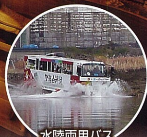
水陸両用バス 平成29年5月運行予定