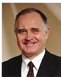
トルストグーゾフ.A.A. プロフィール