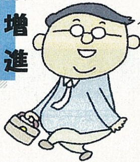
今日よりもあと 1,000歩(約10分) 多く歩きましょう！