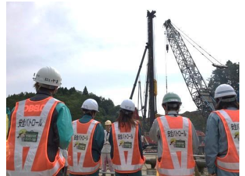
■H28.09_合同パトロール &現場見学会■

当会議の設立からこの度のフォーラムまでの取組や現場監督のお仕事ブログなどホームページで紹介しています。 会員募集もしておりますので是非アクセスしてみてください！