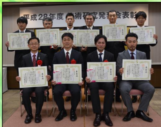
●平成28年度技術研究発表会

応募用紙の作成は、限られたスペースにポイントを取りまとめ、第三者へ趣旨を伝える必要があるため、文章能力の向上、また作成した応募用紙を使用して社内発表を行うなど、プレゼンテーション能力向上にも役立ちます。社員教育の一環として取り組まれている会員企業もありますので、是非、この機会にご検討のほどよろしくお願いします。