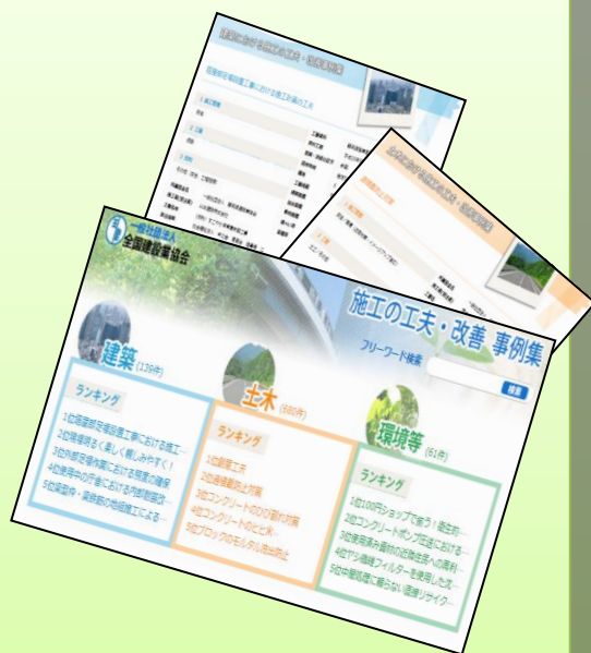
●事例掲載（全建ホームページ）

また、特に優れた事例については、 本会「技術研究発表会」 において、 事例発表 して頂きます。