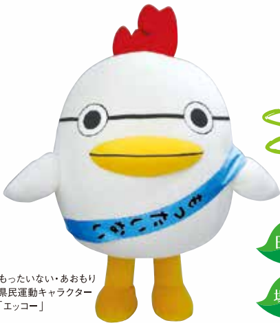
もったいない・あおもり 県民運動キャラクター 「エココ」

ごみ排出量やリサイクル率の改善、様々な影響が懸念される地球温暖化問題。これらの課題解決に向け推進してきた「もったいない・あおもり県民運動」は今年で10周年を迎えました。今一度、地球とあおもりの未来のために私たち一人ひとりができることを考え、「もったいない」を再認識しませんか？