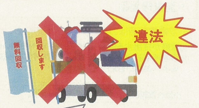
解体業者、不用品回収業者等（一般廃棄物処理業の許可なし）が回収