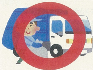
市町村の指定する方法